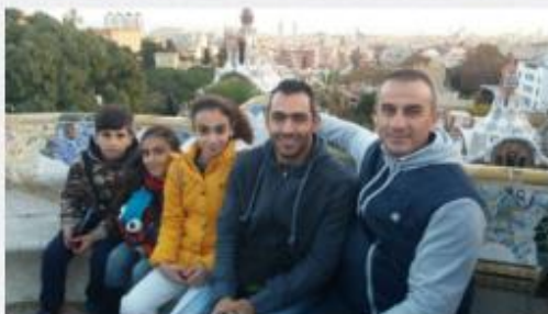
ΚΟΙΝΩΝΙΑ 03 Δεκεμβρίου 2016

στο ευρωπαϊκό πρόγραμμα ERASMUS+ KA2 σε συνεργασία με τέσσερα άλλα σχολεία από την Ισπανία, την Ιταλία, την Πολωνία και την Ελλάδα. Η σύμπραξη των πέντε σχολείων έχει θέμα «Meaningful ICT in collaboration and in a safe and smart environment: our path towards a smart school» και θα διαρκέσει δύο σχολικές χρονιές (2016 – 2018). Ένας πιο σύντομος τίτλος που χρησιμοποιούμε για το πρόγραμμα είναι SMART: